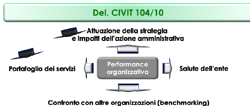
Figura 1.- Il modello di misurazione e valutazione della performance organizzativa proposto dalla CIVIT (del. 104/10)

Il PEG 2019 segue tale modello di riferimento, arricchendo la struttura dei PEG precedenti con le seguenti modalità: